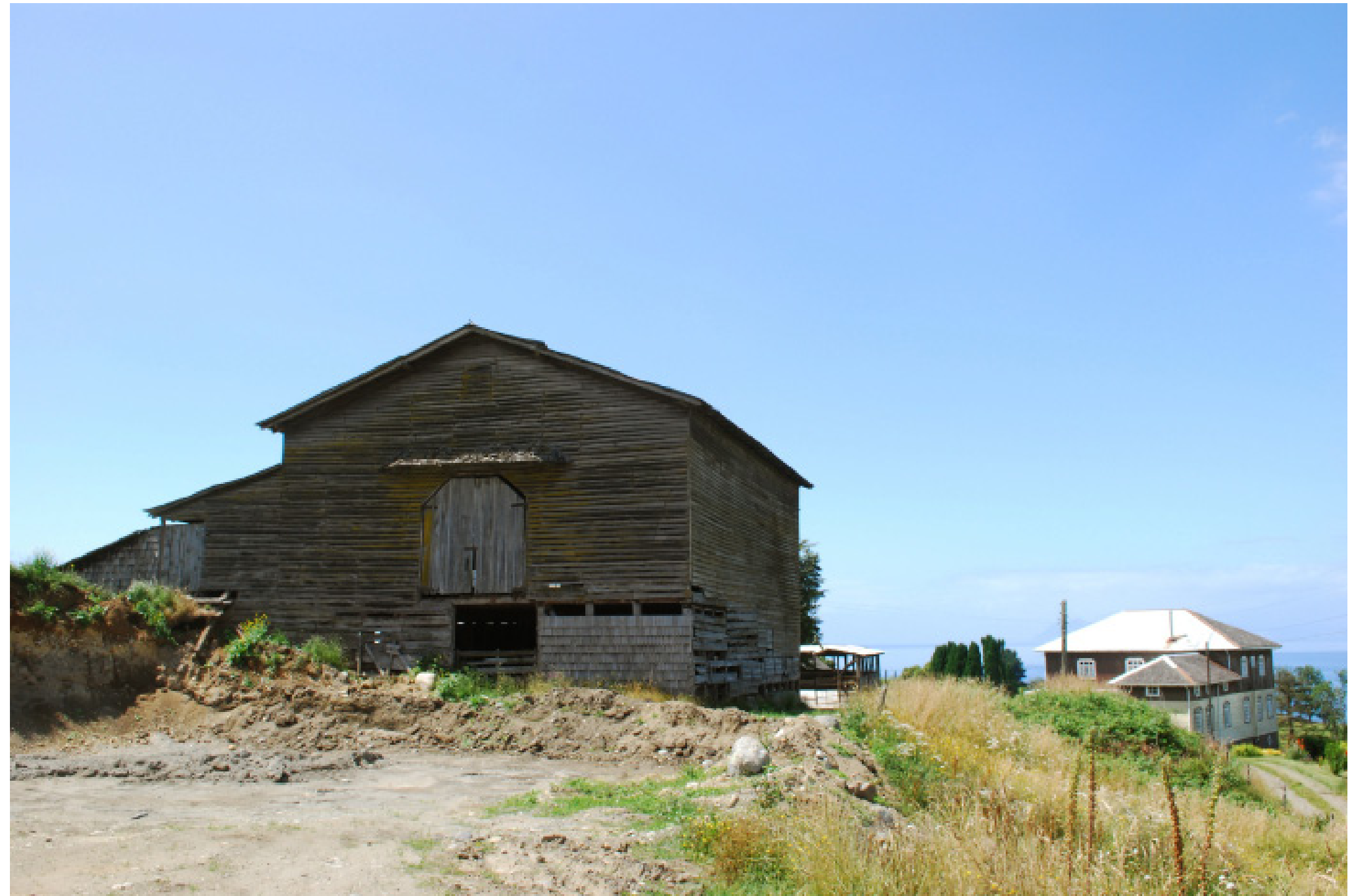
FOTO REVESTIMIENTO EXTERIOR