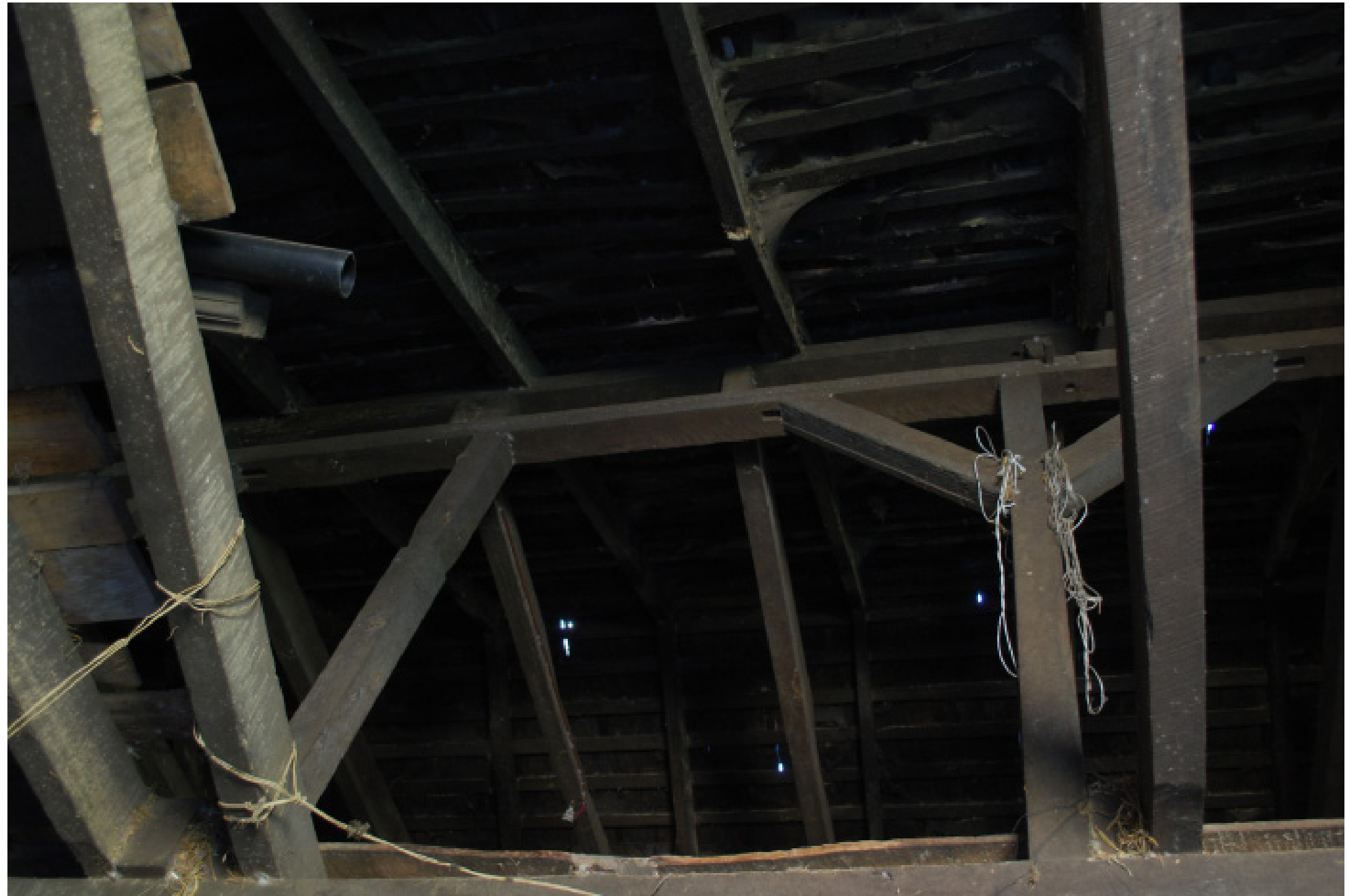
FOTO ESTRUCTURA TECHUMBRE