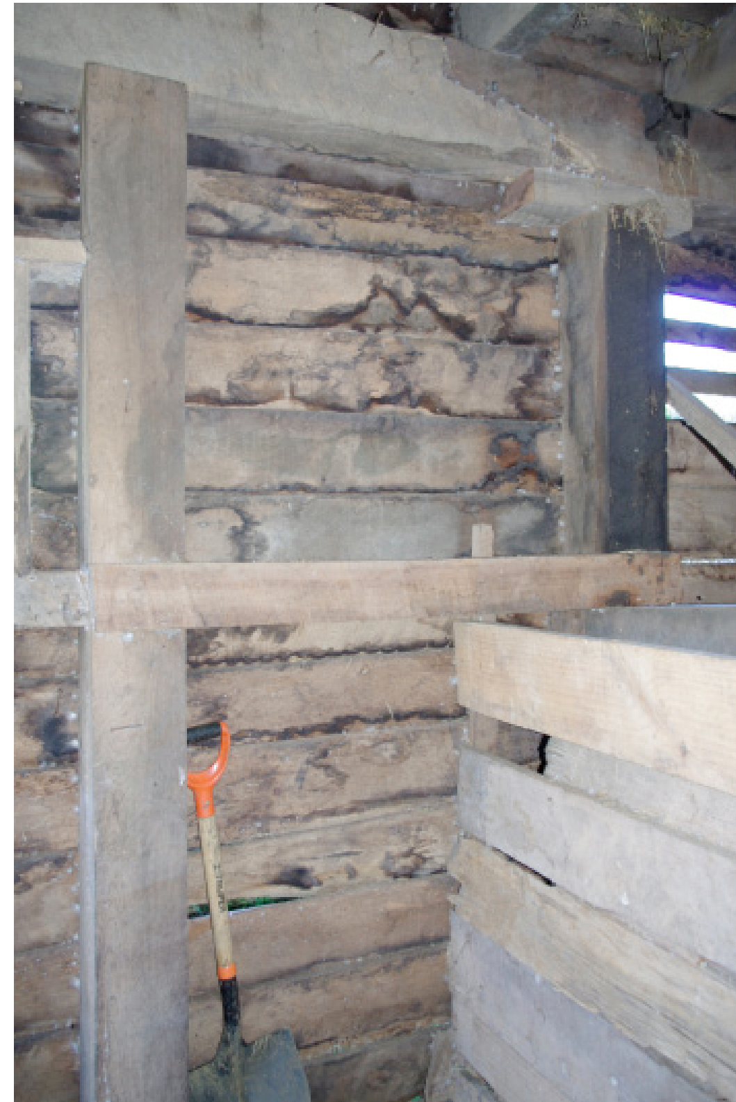
FOTO ESTRUCTURA PERIMETRAL