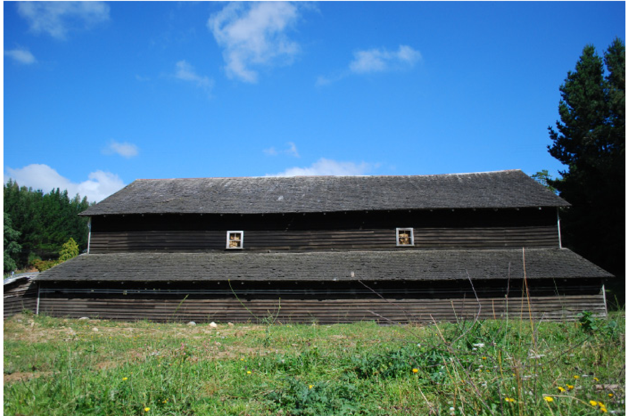
FOTO REVESTIMIENTO EXTERIOR