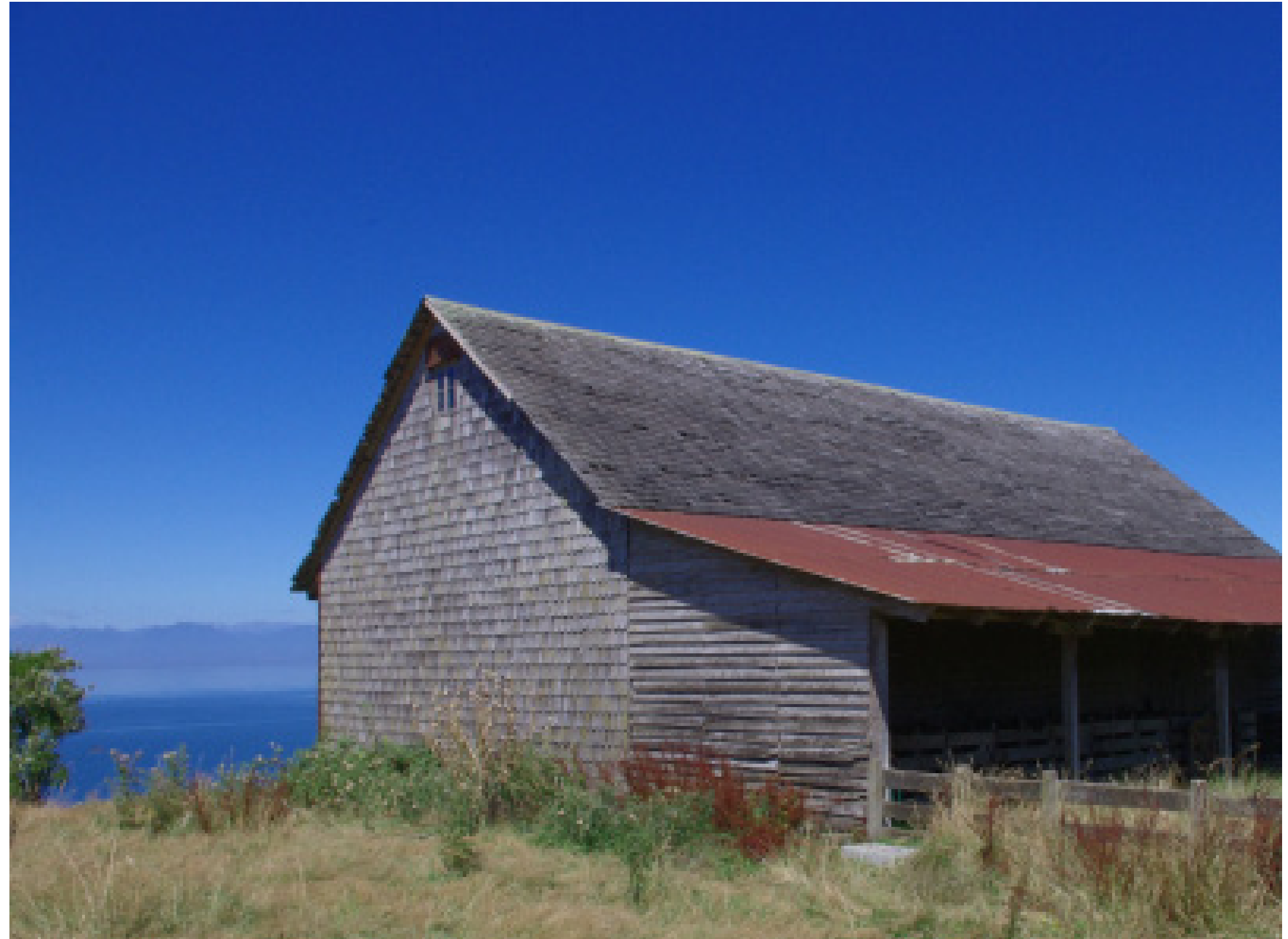
FOTO REVESTIMIENTO EXTERIOR